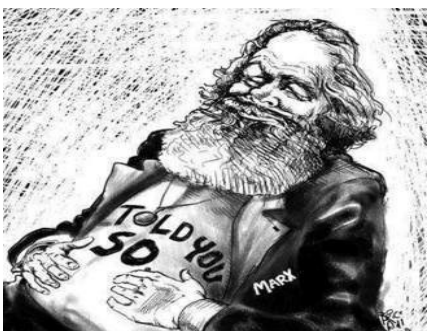
En nöjd Karl Marx efter kapitalismens fall.

"Den ekonomiska cykel vi nu upplever, är ändå ganska annorlunda än tidigare kriser. Tusentals av de bankirer och chefer, som deltog i skapandet av bostadsbubblan, var oförberedda på de 'dump'-aktiviteter som sattes i verket under 2008. Det skulle vara fel att säga, att vi nu är tillbaka i den situation av ekonomisk recession, som världen fick uppleva 1988-89, utan här och nu konfronteras vi istället med en fundamentalt ny situation i vårt styrsystem – kulmen av en finansiell statskupp".