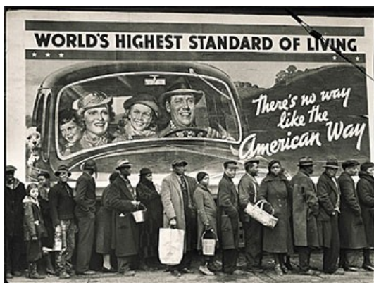
Arbetslösa amerikaner i kön till sopp-köket.

Arbetslösa amerikaner i kön till sopp-köket. Detta menat att samverka i ett totalt crescendo av katastrofer* ( problem ), som världens befolkningar skall reagera på ( reaktion ), innan förövarna lägger fram sin lösning i form av en världsregering, en världsvaluta och en världsarme – allt styrt under en världsdiktator vid namn Lucifer** . Detta är vad som just nu utspelar sig och som förväntas ha sin höjdpunkt inom något år!