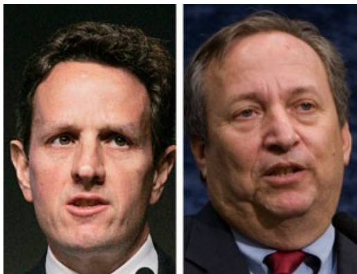
Timothy Geithner och Lawrence Summers – två finanistorpeder.

Det var verkligen avslöjande, att observera dem på en presskonferens, ett par dagar innan president Barack Obama, den 20 juni 2008, presenterade nya planer för statlig reglering av finansmarknaderna. Här stod det helt klart att den ekonomiska elitens våtaste drömmar skulle gå i uppfyllelse.