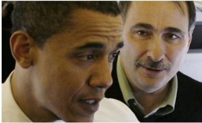
Axelrod: Obamas röst på teleprompterskärmarna

Åtminstone de flesta av 'Obamas' politiskt utnämnda ekonomiska medarbetare är fundamentalt förbundna med sionisten Robert E. Rubin, Bill Clintons riksgäldschef, vilken hade tillsyn över den finansiella avreglering som slutligen ledde fram till den nuvarande krisen. Rubin avgick nyligen från Citigroup , efter att först ha uppmuntrat till de beslut som försatte företaget på gränsen till kollaps. Rubin utsågs i januari 2009, av Marketwatch , till en av de "10 mest oetiska personerna inom affärslivet", och hans skyddslingar och nära kollegor styr nu USA:s ekonomi under Obama.