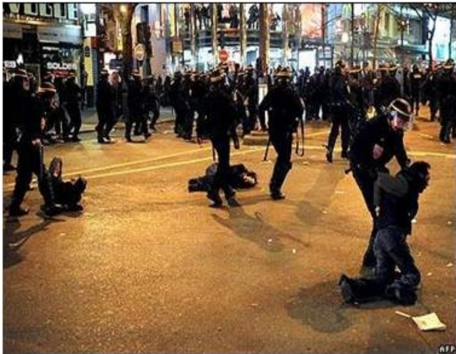
Upplopp i Frankrike över den ekonomiska situationen

Låt oss räta ut det här: De vill att du skall ta till upplopp som svar på den ekonomiska katastrof som nu utvecklar sig och redan kan man se att folk går på det här.