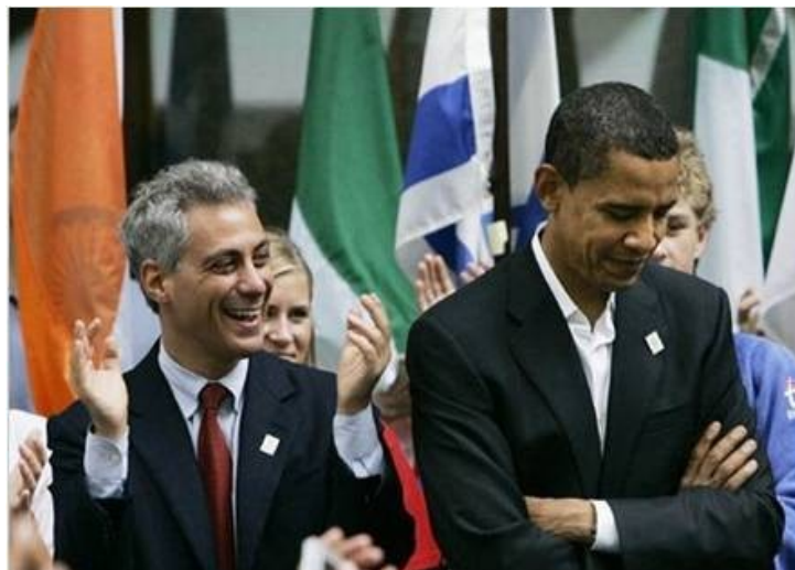
Emanuel: marionettdockan Obamas dirigent

* Halvgenomskinlig glasskiva där talare med begränsad förmåga att hålla ett tal presenteras med vad han skall säga.