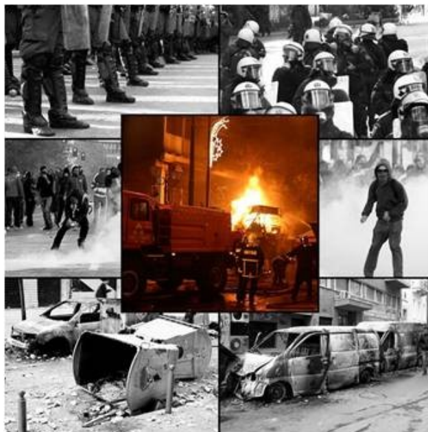
Upplopp i Grekland

Eftersom massprotester runt om i världen redan inträffar, är de inte längre bara förut-sägelse och i avvaktan att den globala ekonomin skall kollapsa i något som liknar den omfattning som planerats, har vi bara sett början än. Omkring 120-tusen människor protesterade i Dublin, mot hanteringen av den ekonomiska krisen i Irland. En miljon demonstranter har syns på gatorna i Frankrike, oljerafinerari- och elverksarbetare i Storbritannien gick ut i en serie strejker i protest mot nyttjande av utländsk arbetskraft, och upploppen runt om i Grekland förra året hade delvis ekonomiska orsaker.